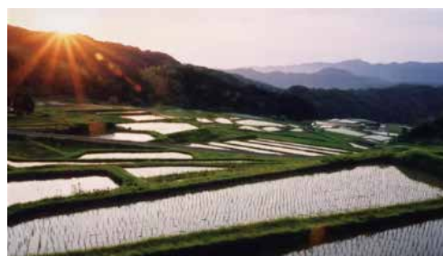
山王寺棚田（雲南市）