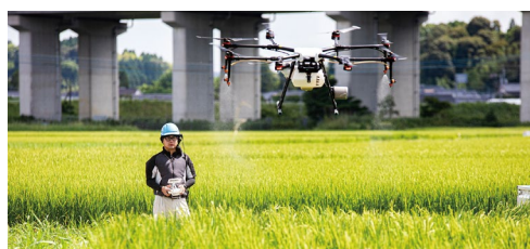
ドローンによる防除

行っています。さらに、獣医師職員による生産獣医療、ET(受精卵移植)事業、高度獣医療による技術提供で畜産農家の収益アップの支援も行っています。これからも「信頼のきずな」を合言葉に役職員一同まい進してまいります。