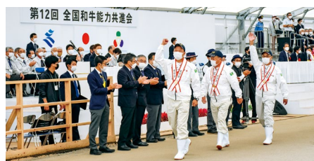
2022 全共で内閣総理大臣賞

産に指定されています。また県南では伝統的なトビウオ漁、県北ではメヒカリの名物料理があります。焼酎生産量も全国1位です。最近では、宮崎市のギョーザ購入額が浜松市や宇都宮市を抜いて日本一となり、話題となりました。