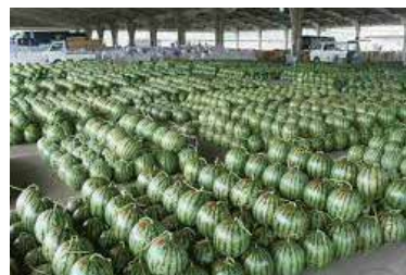
植木青果市場に並ぶスイカ