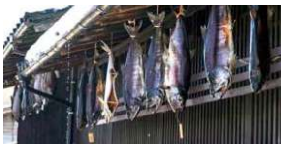
塩引き鮭(村上 鮭塩引き街道)