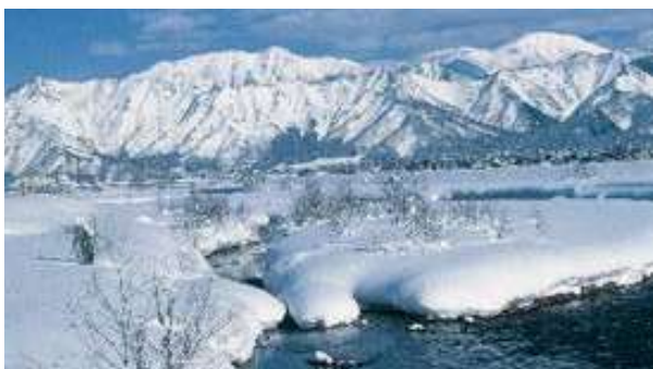
魚沼地方の雪景色

このような新潟県についてまず思い浮かべるのは雪ではないでしょうか。県境の山沿いの魚沼地域、上越地方は全国有数の豪雪地帯で一晩に1mを越す雪が降ることも稀ではありません。この雪が米をはじめ、枝豆、なす、すいか、梨、柿、桃などの農産物を育み、その中でも新潟県は「えだまめ」、「越後姫(イチゴ)」、「ル・レクチェ(洋梨)」のブランド化を推進しています。また、豊富で良質な水が酒造りを支え、酒蔵数(免許場数)は99で全国1位、生産(製成)量は3位となっています。